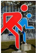
SCC planerings- grupp

Ny områden Kartor Markägarkontakter Fastighetsägarkontakter BRF:er