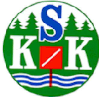
Stockholms Skogskarlarars klubb