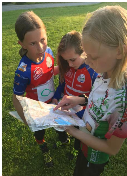
Domarudden kunde genomföras trots Coronapandemi. För många ungdomar sommarens höjdpunkt