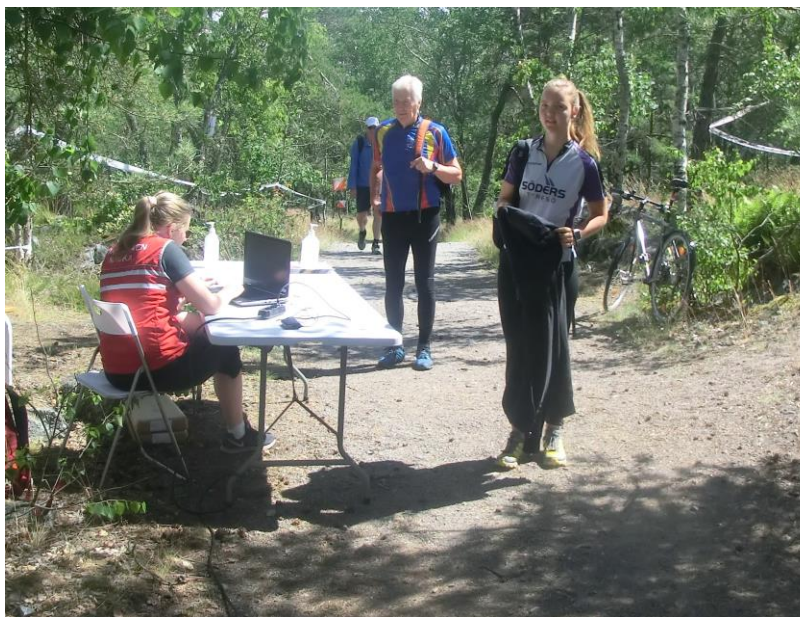
Ravinen var först ut med att utmana restriktionerna och nedstängningen av idrotten 2020. Trekvällars kunde genomföras efter många diskussioner med RF och polisen. Erfarenheterna gav råg i ryggen till fler arrangörer i Stockholm och Sverige, vilket gjorde att det blev någon form av en höstsäsong trots allt. Här incheckningen till hemområdena på den lilla arenan vid Strålsjöstugan.