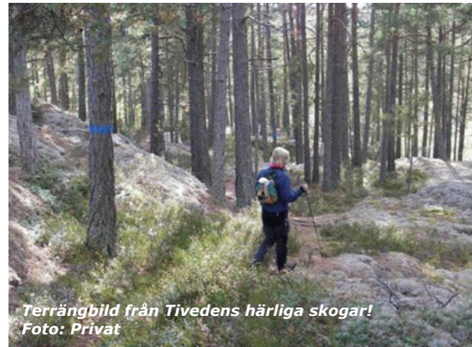
Terrängbild från Tivedens härliga skogar!

Västergötlands OF välkomnar naturligtvis den nya föreningen och önskar Per Emion och klubbkamrater stort lycka till med orienteringsverksamheten.